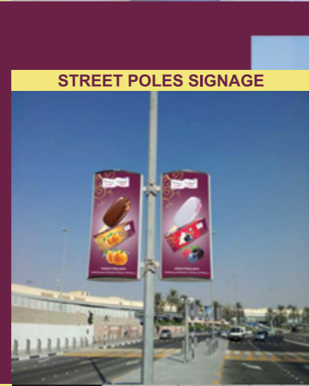
STREET POLES SIGNAGE