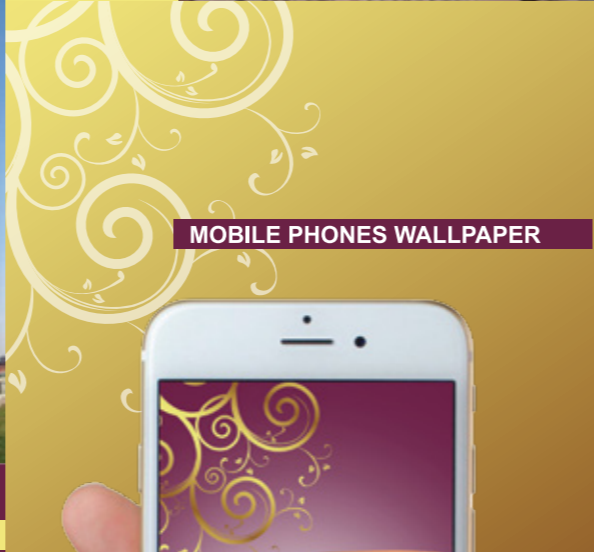
MOBILE PHONES WALLPAPER