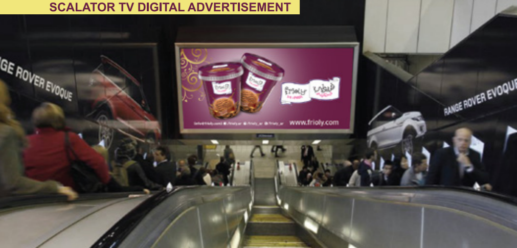
SCALATOR TV DIGITAL ADVERTISEMENT