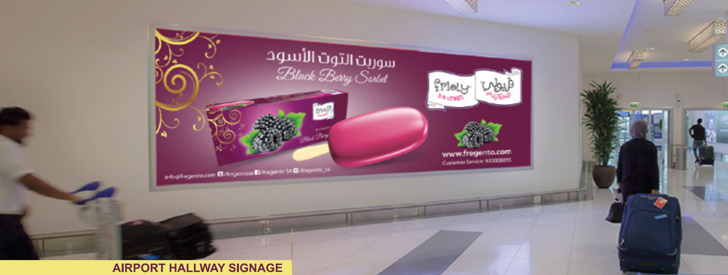
AIRPORT HALLWAY SIGNAGE